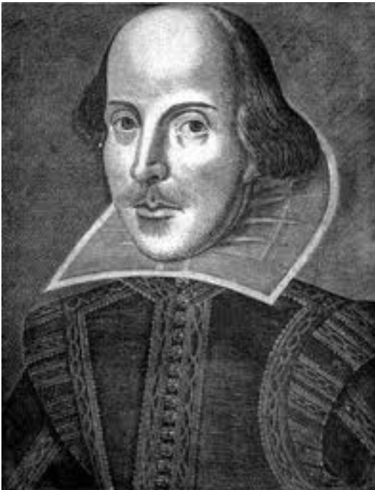
Afbeelding door Droeshout zoals op First Folio

Naar de jaren nadien - tot 1592 - wordt gewoonlijk verwezen als Shakespeares 'lost years' omdat er zo goed als geen informatie over die jaren terug gevonden is. Mogelijk trad hij toe tot een rondtrekkend gezelschap van acteurs en kwam hij zo in Londen terecht. Tegen 1592 is William Shakespeare in ieder geval een gevestigde naam in de theaterwereld in Londen, als acteur en toneelschrijver. In 1593 en 1594 publiceert Shakespeare enkele verhalende gedichten, vermoedelijk omdat de theaters toen gesloten waren wegens het uitbreken van de plaag.