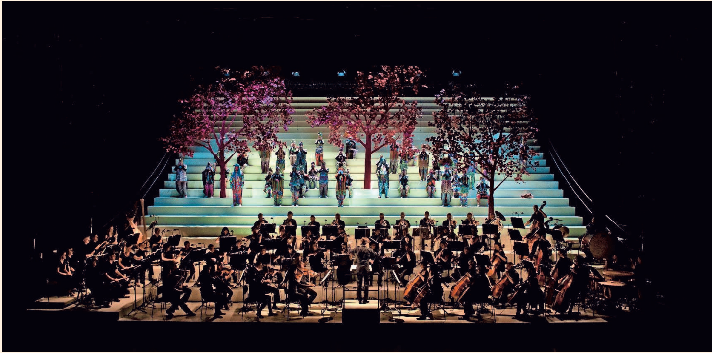
Het symfonisch orkest van De Munt speelt een hoofdrol in de drie opera's van Rachmaninov, op de foto 'Aleko'.