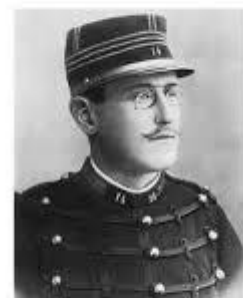
Lettres d'un innocent