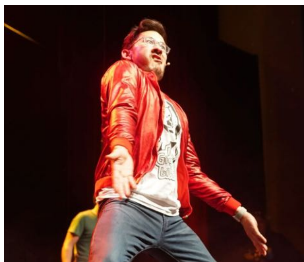
Markiplier.