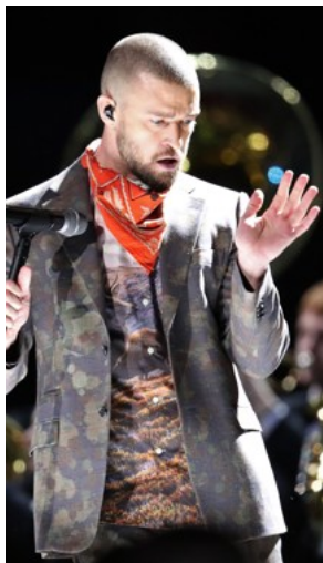
Justin Timberlake.

Benieuwd of het lauwe onthaal van zijn nieuwste album de rush op tickets voor de komende concerten gaat stremmen. Want een superster blijft Justin Timberlake natuurlijk wel. In Noord-Amerika verkocht The Man of the Woods Tour , vernoemd naar zijn jongste plaat, al bijna een half miljoen tickets. Het Europese luik van die tournee start eind juni in Parijs. Op dinsdag 17 juli houdt JT halt in het Antwerpse Sportpaleis. De voorverkoop voor die show start vandaag om 10u. Ticketprijzen variëren van 50,90 tot 123,70 euro. (gj)