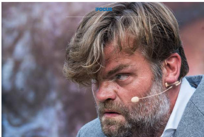
Ashes to Ashes

Devlin kijkt machteloos toe. Hoewel. In zijn blik liggen honderden vragen. Degand speelt tijdens deze voorstelling voortdurend met die blikken. Per blik belicht hij een ander facet van zijn personage. Soms lijkt Rebecca's man, minnaar, therapeut of moordenaar is. Degand suggereert het allemaal, en telkens huiveringwekkend overtuigend. De scène waarin hij met een zware steen in de hand naar het publiek staart, bezorgt je kippenvel.