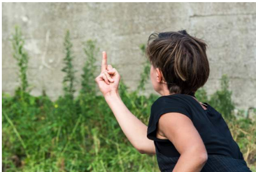
Ashes to Ashes

Je kijkt naar twee mensen die gek worden van voortdurend in elkaars nabijheid te zijn - herkenbaar met het voorjaar nog vers in het geheugen... - maar evenmin zonder elkaar kunnen. Devlin lijkt per moment te verpoppen tot de man die Rebecca wil: een geliefde, een therapeut, een potentiële moordenaar. Hij tracht alle mannen te zijn die ze nodig heeft. Die rol zit Degand zo lekker als het halflange grijze jasje dat hij draagt. Wanneer Rebecca in gedachten mijlenver heen is en monkelend naar het publiek kijkt, laat Degand zijn Devlin een monoloog afsteken die slechts uit een woord bestaat: 'liefje'. Maar elk 'liefje' zegt hij anders. Het ene 'liefje' zindert van hartstocht, het andere 'liefje' liit van woede of van wanhoop. Wauw. Devlin wil maar een ding: zijn Rebecca niet verliezen.