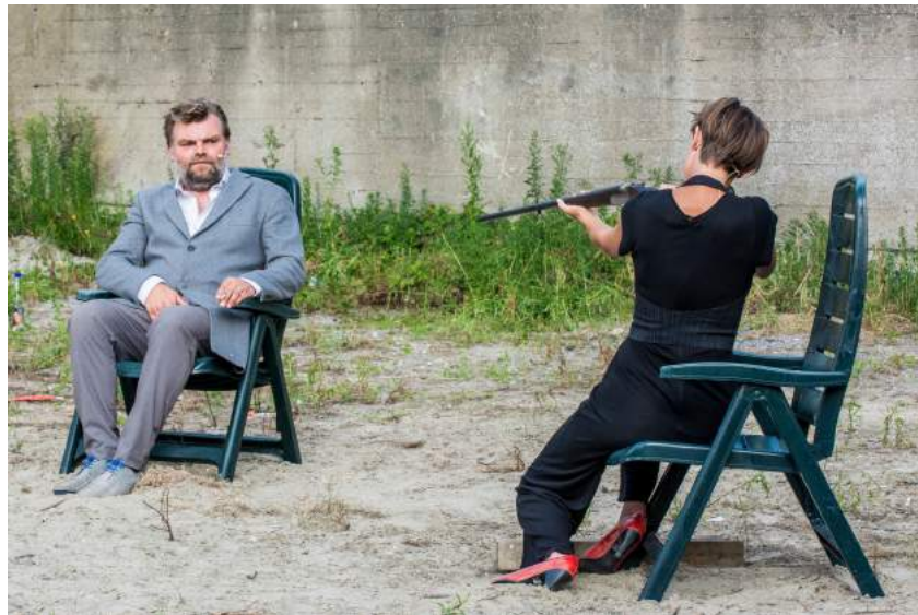
Ashes to Ashes © Mahieu Yvan

Die voorstelling is een ruwe, sensuele encensering van Ashes to Ashes , een kort stuk van Harold Pinter. Hij schreef het in 1996, het ging in première bij Toneelgroep Amsterdam. Pinter daagt de acteurs uit te balanceren tussen twee thema's: de liefde en de vierkant draaiende wereld. Hij schetst de borrelende frustraties tussen twee geliefden Devlin en Rebecca. Die passionele problemen plaatst hij tegenover de herinneringen aan de holocaust. Hoe? Door Rebecca op te zadelen met waanbeelden die haar gedachten voortdurend doorkruisen als voorbijrazende treinen.