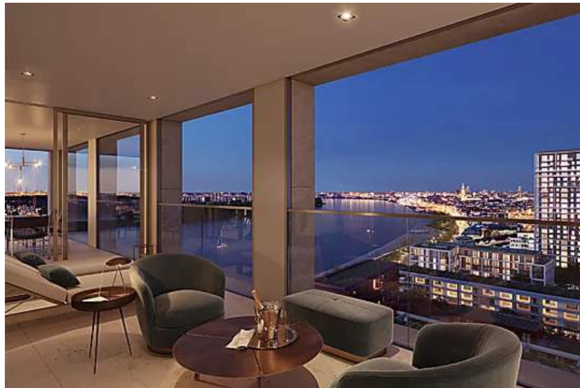
Woon hoog en groots met zicht op Schelde en binnentuin, Antwerpen Scheldehof (https://www.scheldehof.be/?utm_source=outbrain&utm_medium=cpc&utm_campaign=out_scheldehof_sep21&obOrigUrl=true)