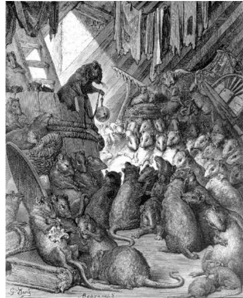
The council of rats- Gustave Dore

Wat volgt zijn 15 verzen uit het Crombrugs handschrift in Middelnederlandse taal.