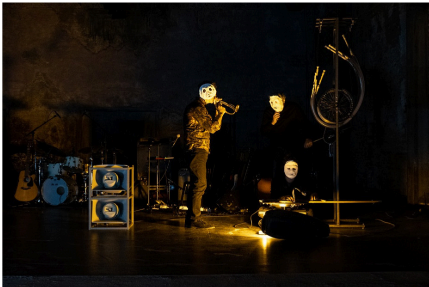
Arsenaal Lazarus