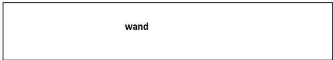
lichtplan : Julia